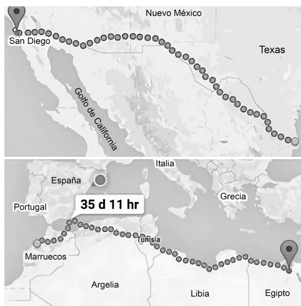
Figura 1. Frontera horizontal

más de 3 000 km si se traza una línea imaginaria de forma horizontal de un extremo a otro, ya sea sobre la frontera territorial Estados Unidos-México o sobre la costa de los países del norte de África (Marruecos, Argelia, Túnez, Libia y Egipto), simulando una metafrontera horizontal en la que se convierten ambas regiones, como se observa en la Figura 1.