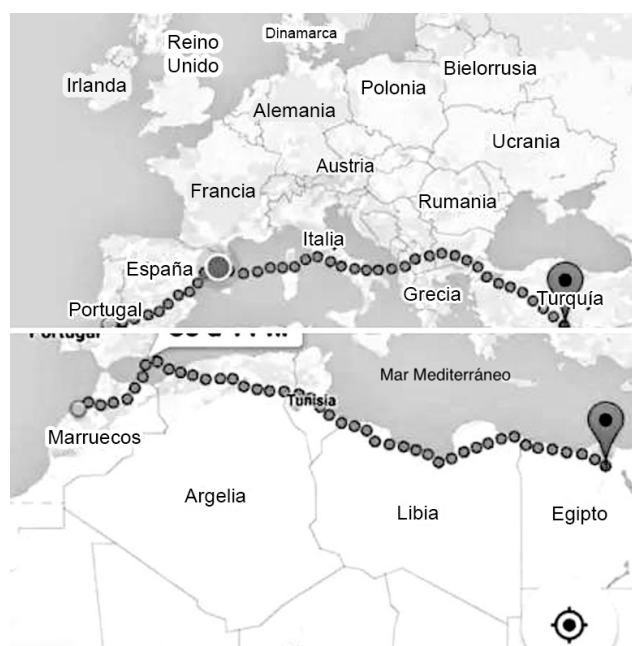
Figura 3. Schengenización