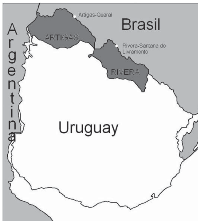
Figura 1 Frontera Uruguay-Brasil

La población uruguaya de esta zona, al igual que la brasileña, acostumbra realizar sus compras de bienes de consumo en aquel lado de la frontera que se encuentra circunstancialmente más barato. La gran variabilidad exhibida en el pasado por el tipo de cambio real bilateral entre