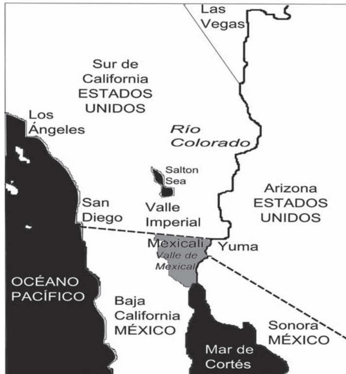
Figura 1 Cauce del Río Colorado del Lago Mead cercano a Las Vegas Nevada en Estados Unidos hasta el Mar de Cortés. Resaltado en color gris el territorio agrícola del Valle de Mexicali