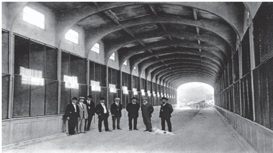
Foto 2. Vista del interior del puente de San Luisito en 1904