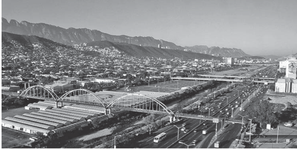
Foto 3. Vista aérea del Puente del Papa desde el Hotel Sheraton

Fuente: < http://www.flickr.com/photos/darijuss/3023230805 >. Fecha de consulta: enero de 2010.