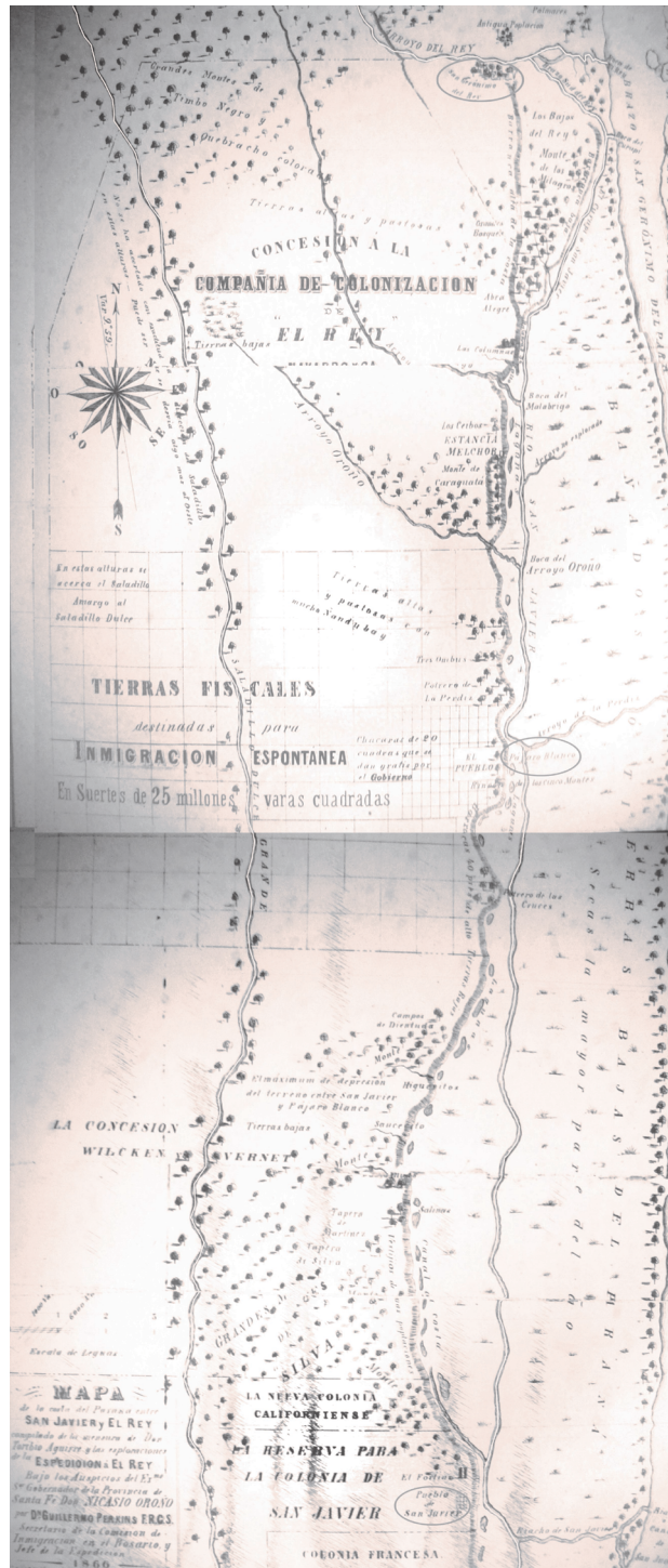
Figura 2: Ubicación geográfica e histórica de la frontera de colonización (Perkins 1867)

Nota: En el mapa se identifican los límites formados por dos antiguas reducciones jesuíticas, al sur de indígenas mocovíes y al norte de abipones, y el área de mejor calidad ambiental donde se establecerá Alexandra Colony.