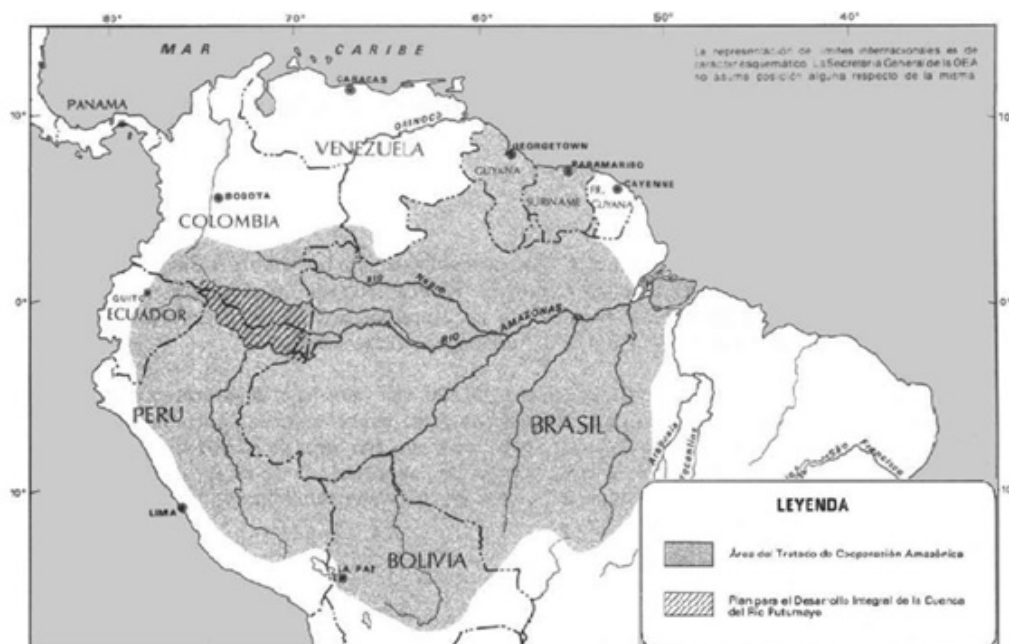
Figura 1: Área del Plan Colombo-Peruano para el Desarrollo Integral de la Cuenca del Río Putumayo y el Tratado de Cooperación Amazónica