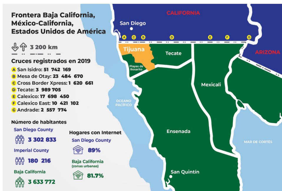
Figura 1: Infografía de población, cruces y conectividad en la frontera californiana