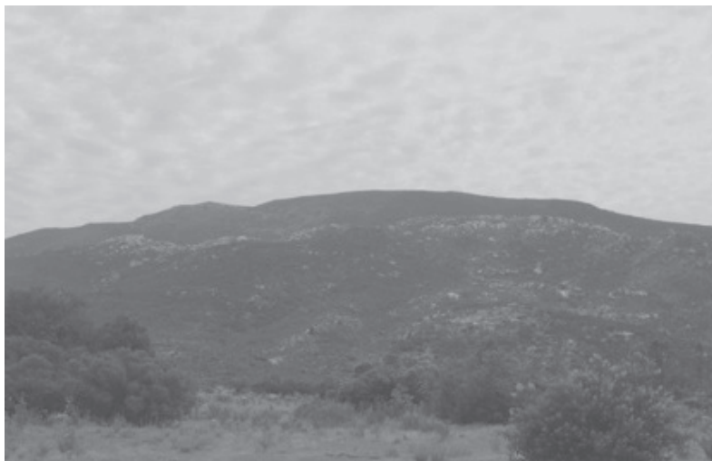
Al sur del asentamiento kumiai San José de la Zorra se observan rocas de granito entre el follaje del chaparral. Este accidente geológico es interpretado como “el rastro que dejó la serpiente”, 2 de julio de 2009.

De acuerdo con nuestra deducción, ese rastro quedó marcado en la colina del sur que no tiene nombre: una franja de roca blanca fragmentada que destaca entre lo oscuro del chaparral. Al investigar, encontramos que el mito que rescató Waterman coincide con nuestra conjetura: “El hombre emprendió el regreso y el monstruo [refiriéndose a la serpiente] caminó tras él, pasando de montaña en montaña y dejando una gran raya blanca en todas partes por donde pasaba. Esta raya todavía puede verse” (Waterman en Martínez, 2003:101).