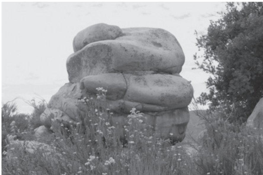
El monolito cabeza de víbora, de perfil y con el frente hacia la derecha, hasta parece tener ojo. En primer plano se puede observar flores de la valeriana y a la derecha, un encinillo. 3 de julio de 2009.

La cabeza del crótalo que aparece en el escudo nacional se asemeja a la de los monolitos ubicados en San José de la Zorra, los cuales tomaron esa apariencia por la erosión del agua y el aire. Ésta es la razón por la cual los kumiai los nombran “cabeza de serpiente”. Sin embargo, debido a lo ya mencionado, sería más apropiado que les llamasen “cabeza de víbora”.